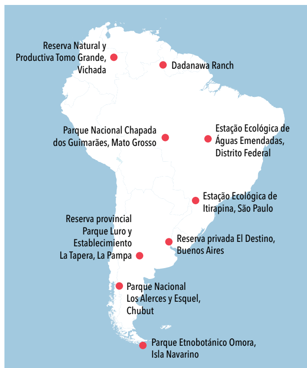
Sitios en que la Red Aves Internacionales estudia las aves migratorias.

Las aves migratorias también pueden ser portadoras de enfermedades. Pueden constituir reservorios de virus, como los de influenza aviar, encefalitis equina y otros,