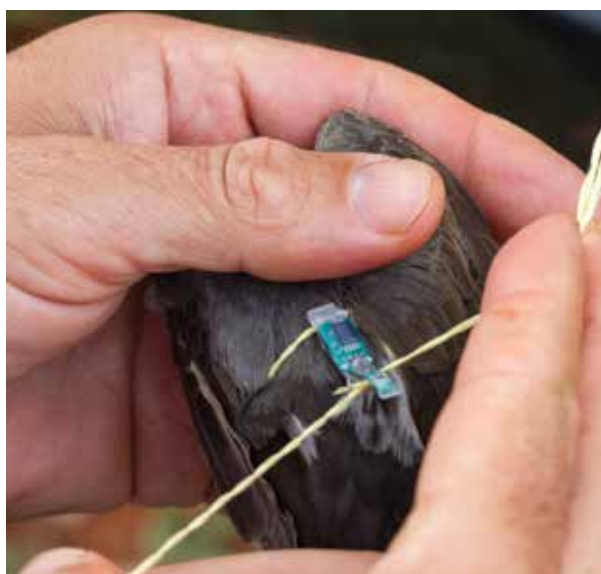
Figura II. Colocación de un geolocalizador en una tijeeta.