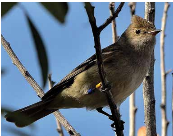
Fiofío silbón ( Elaenia albiceps ), que se reproduce en los bosques andino-patagónicos y migra a zonas tropicales para pasar el invierno. En una de sus patas se advierten anillos cuyos colores permiten identificar a individuos en el campo.

y actuar de vectores pasivos de esas enfermedades entre países y aun continentes. Para predecir adónde podrían transportar enfermedades, se necesita estudiar cuáles especies podrían hacerlo, entre qué puntos migran y sus rutas de viaje.