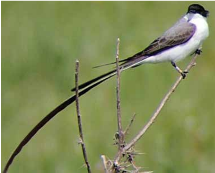
Tijereta ( Tyrannus savana ), común en la llanura pampeana desde mediados de la primavera hasta el fin del verano. El ejemplar de la figura tiene en una pata anillos que lo identifican. Pasa el invierno en el norte de Sudamérica.