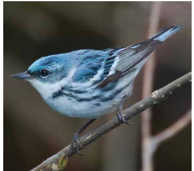
Reinita cerúlea ( Setophaga cerulea ), que entre mayo y julio nidifica en los bosques caducifolios del este norteamericano y pasa el invierno boreal en Centroamérica y el norte de Sudamérica.

El estudio de estas migraciones proporciona una mayor apreciación del mundo natural y brinda información para la conservación de la naturaleza y el cuidado de la salud humana. Entre otras cosas, hemos aprendido que las poblaciones de varias especies de aves migratorias están disminuyendo, entre ellas las de algunas de las regiones templadas norteamericanas que pasan el invierno en el trópico, como la reinita cerúlea ( Setophaga cerulea ), la cual nidifica en los bosques caducifolios del este de América del Norte entre mayo y julio, y pasa el invierno boreal en América Central y el norte de América del Sur. Su estudio durante todo el ciclo anual permitió establecer en qué época del año enfrenta los factores responsables de la abrupta disminución de sus poblaciones, que puede haber alcanzado el 70%. Pero se conoce muy poco sobre la situación de las poblaciones de similares migrantes en Sudamérica. Algunas especies podrían estar disminuyendo sin que lo sepamos y sin que hayamos investigado sus rutas migratorias, establecido dónde pasan el invierno y determinado si existen en esos lugares peligrosos para su supervivencia, por ejemplo, destrucción del hábitat, contaminación o caza ilegal.