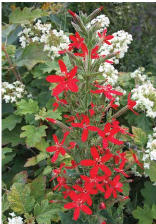
Royal catchfly (atrapamoscas real), planta perenne ( Silene regia ) nativa de los pastizales norteamericanos polinizada por el picaflor de garganta rubí.