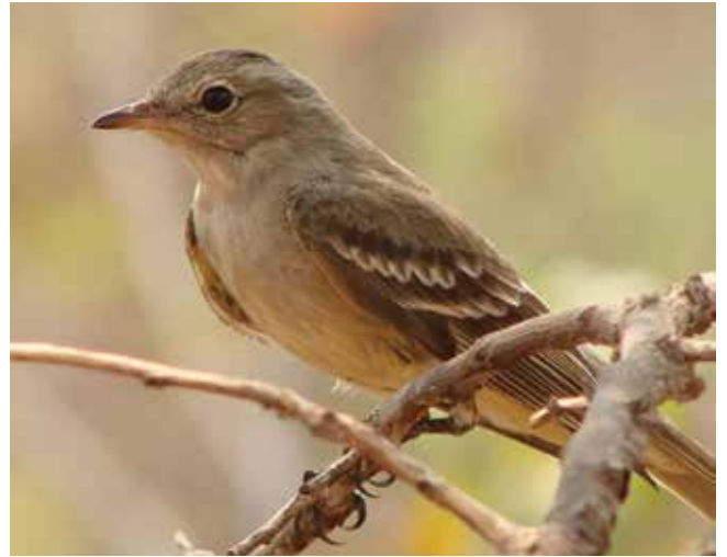
Fiofio belicoso ( Elaenia chiriquensis ). Habita la sabana brasileña o cerrado y migra entre zonas tropicales de Sudamérica.

Esta pequeña ave (13cm) se caracteriza por la coloración rojo brillante del macho. Se alimenta principalmente de insectos y tiene una distribución invernal muy amplia, entre el chaco y el norte de la Amazonia. Es una de las primeras aves migratorias en arribar al centro de la Argentina al inicio de la primavera. Se la estudia en la reserva privada El Destino, provincia de Buenos Aires, y en el establecimiento La Tapera, provincia de La Pampa, un ambiente de pastizales y bosques de caldén. Se espera conocer la duración y velocidad de su migración, así como las rutas de esta, y dónde pasan el invierno las diferentes poblaciones para saber, entre otras cosas, si los ejemplares que nidifican en Buenos Aires lo hacen en el mismo sitio que los que nidifican en La Pampa.