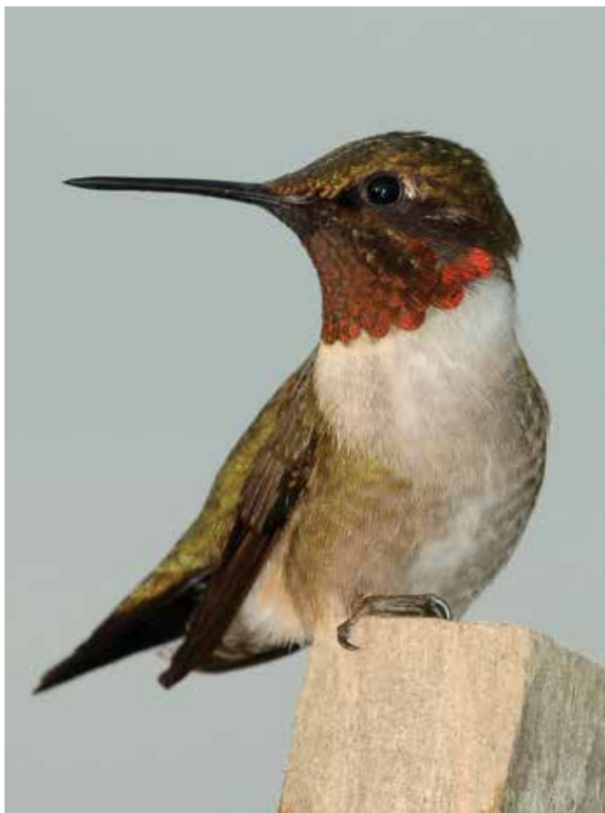
Colibrí de garganta rubí ( Archilochus colubris ), que se reproduce en áreas templadas del este de los Estados Unidos y Canadá, y pasa el invierno boreal en el trópico.