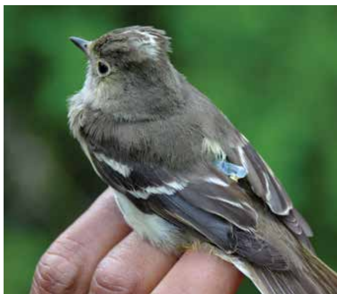
Figura III. Fiofío silbón con geolocalizador.