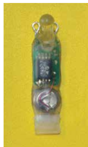
Figura I. Geolocalizador. Mide 2,5cm.

Los dispositivos que se usan tienen tres componentes básicos: una célula fotoeléctrica, una batería y un microchip con reloj y memoria que almacena información sobre intensidad de luz. Los más pequeños pesan alrededor de medio gramo, lo que permite colocarlos en aves que pesan 14g, como el churrinche. El geolocalizador registra la intensidad de la luz solar cada 10 minutos, lo que lleva a determinar la duración del día, y ese dato a su vez permite calcular la latitud en que está el ave cada día del año. La longitud se calcula mediante el reloj, por la diferencia entre la hora de salida del sol en la posición del ave y la correspondiente a un sitio de longitud conocida, de manera similar a lo que hacían los marinos en el siglo XVIII para calcular su posición usando un reloj a bordo del barco. Los datos colectados por el geolocalizador permiten estimar latitud y longitud con una precisión de entre 50 y 300km, un error producido por factores como la nubosidad o que el ave esté al sol o a la sombra, por ejemplo, dentro de un bosque. Para especies como el fiofío silbón, cuyos individuos viajan cada año unos 6000km entre el sur de la Patagonia y la región amazónica, esa precisión es suficiente con el fin de determinar la ruta migratoria y conocer dónde pasan el invierno.