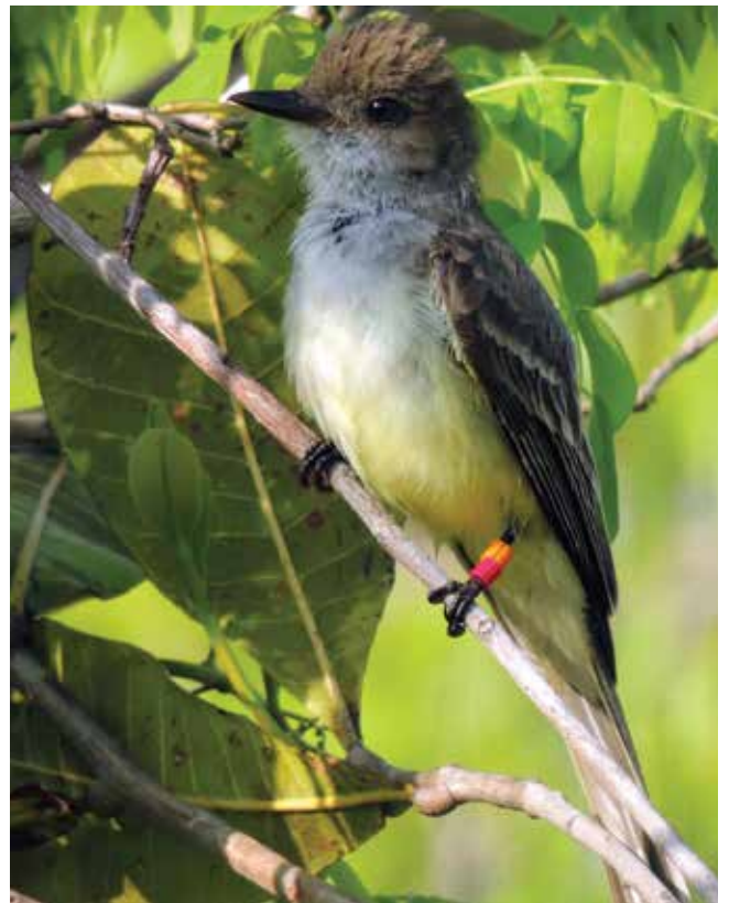
Burlisto de pico canela ( Myiarchus swainsoni ), especie con una amplia distribución geográfica en América del Sur, de cuya biología y ecología se conoce muy poco. Exhibe anillos identificatorios en una pata.

En síntesis, durante las temporadas reproductivas de 2009 y 2010 se colocaron 43 geolocalizadores en sendas tijeretas que estaban nidificando en El Destino. Seis fueron recuperados cuando se las volvió a capturar en ese sitio en años siguientes. Todas habían iniciado la migración entre fin de enero y fin de febrero; habían volado hasta 66km por día, por el centro de Sudamérica, durante aproximadamente dos meses, y cubierto distancias de