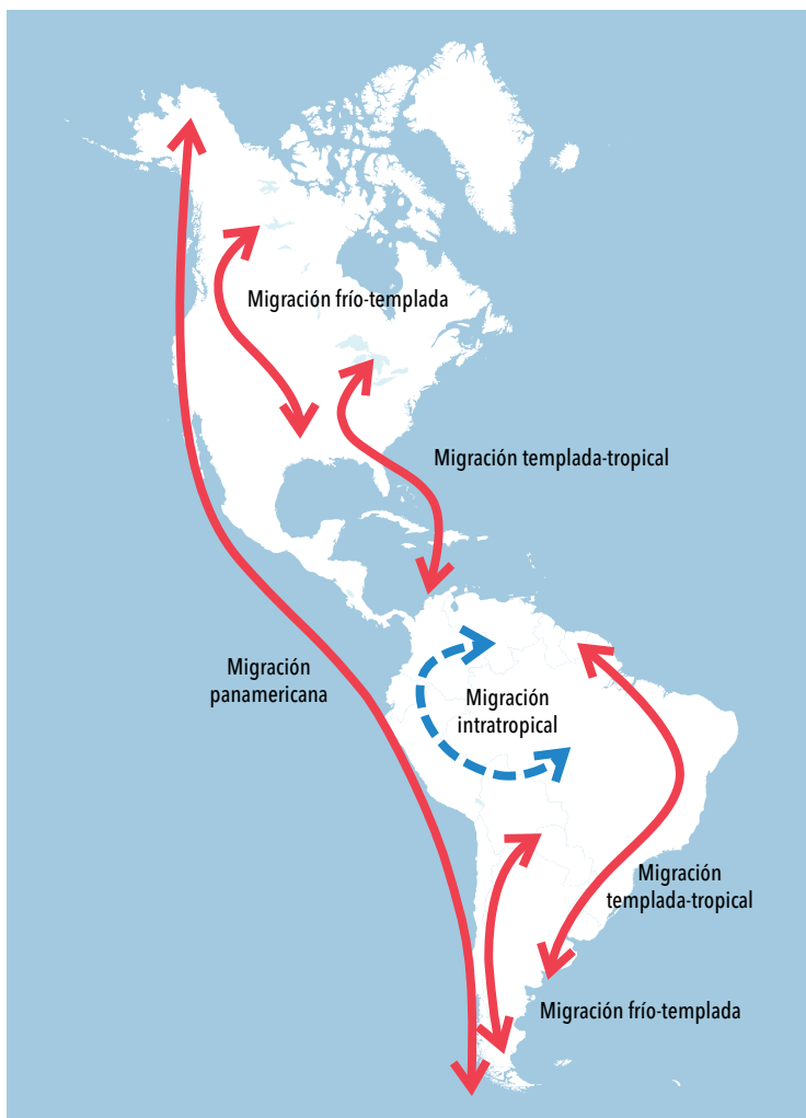
Esquema de las migraciones de larga distancia de las aves del Nuevo Mundo.