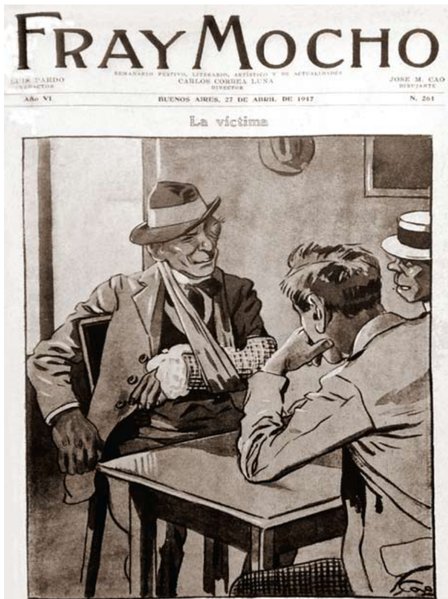
Caricatura publicada en 1917 en el semanario Fray Mocho por el dibujante José María Cao. El diálogo al pie dice: -El brazo me lo rompieron en una manifestación aliadófila, y el ojo me lo hincharon en una manifestación germanófila. -¿Y a qué fuiste a las dos manifestaciones? -Fui en calidad de neutral.