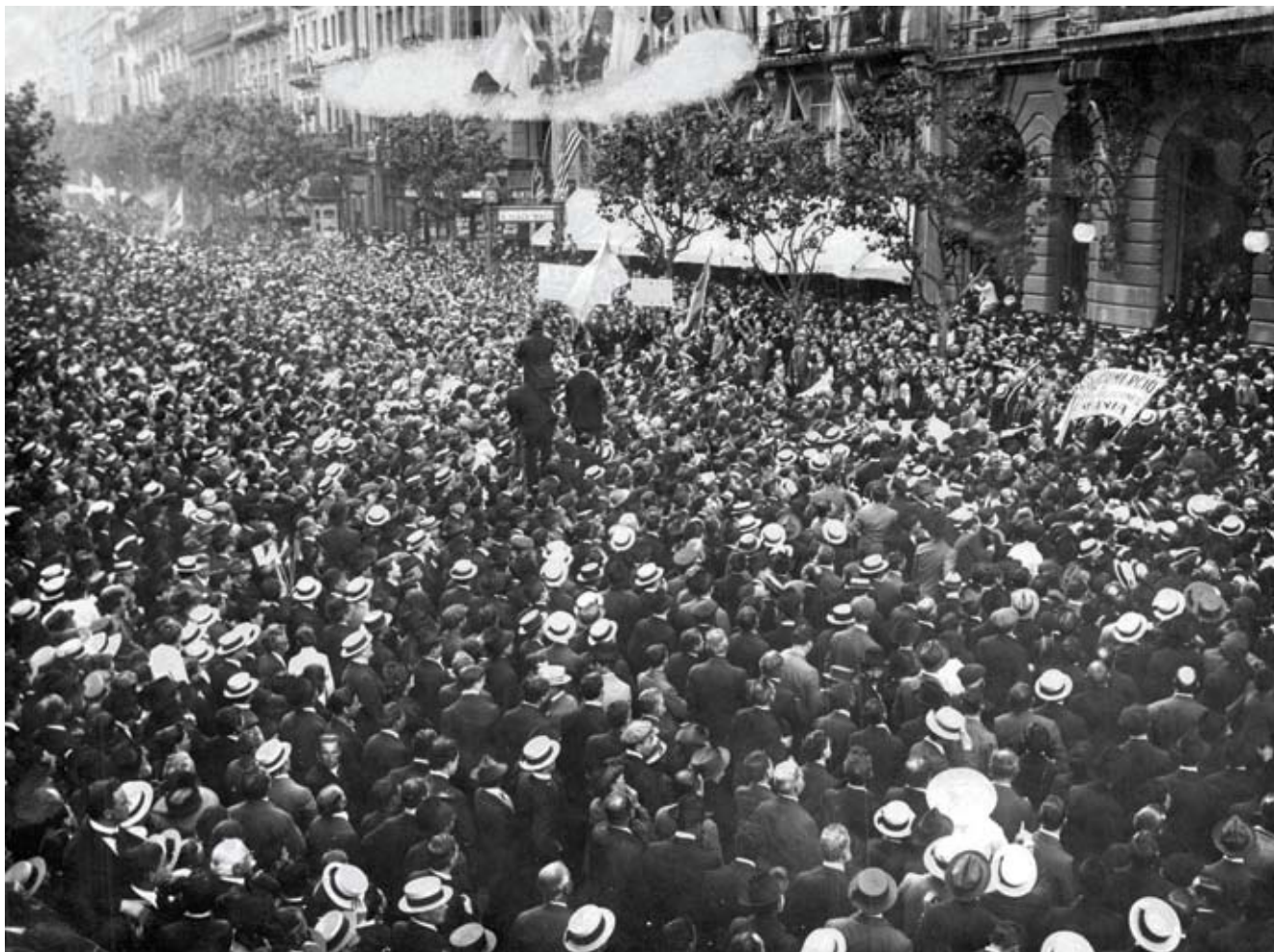
Manifestación de noviembre de 1917 ante el diario La Prensa , en la avenida de Mayo, en solidaridad con Italia.

Hasta 1917 la guerra suscitó un notable interés en la opinión pública, que la contempló como un espectáculo distante que activaba una adhesión emotiva a la causa de los bandos contendientes en función de los lazos históricos, económicos, demográficos y culturales que ligaban al país con Europa. Pero en última instancia se consideraba que no concernía directamente a la Argentina. La guerra europea, como se la denominaba por entonces, fue intensamente discutida en la prensa y entre algunos intelectuales, que debatieron sobre las causas y las responsabilidades de su desencadenamiento y tomaron partido explícito por uno u otro de los beligerantes.