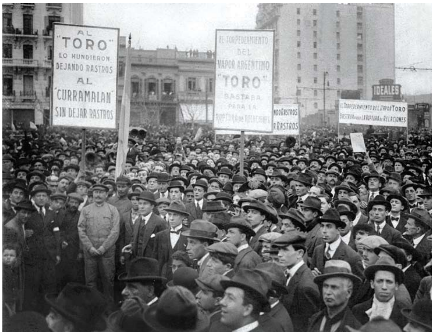
Manifestación acaecida en octubre de 1917 en reclamo de la ruptura de relaciones diplomáticas con el Imperio Alemán. Adviértase la mención del buque Curramalán , que desapareció sin dejar rastros en diciembre de 1916 tras partir de Inglaterra hacia la Argentina. No se pudo establecer si naufragó o si –como recomendó Luxburg– fue hundido sin dejar rastros por submarinos alemanes. Ante la falta de evidencias, y a diferencia de lo que hizo con el Monte Protegido , el Oriana y el Toro , el gobierno argentino no reclamó por vía diplomática.

sudoeste de Gibraltar. Esos incidentes fueron utilizados por el gobierno de los Estados Unidos para incitar –sin éxito– al argentino a abandonar la neutralidad. Para ello difundió públicamente por la agencia Reuters unos telegramas secretos enviados a su gobierno por el ministro de Alemania en la Argentina, el conde Karl von Luxburg (1872-1956), que habían sido descifrados en Londres y comunicados a Washington. En ellos el diplomático germano se refirió al ministro de Relaciones Exteriores local, Honorio Pueyrredón, como ‘un conocido burro y anglófilo ( ein bekannter Maultier und Anglophil )’, y recomendó no continuar atacando barcos argentinos o, en su defecto, que fueran hundidos ‘sin dejar rastros’ ( Spurlos versenkt ). La difusión de esos comunicados conmocionó a la sociedad, quebró el consenso alrededor de la neutralidad que existía hasta entonces y modificó la percepción social de la contienda.