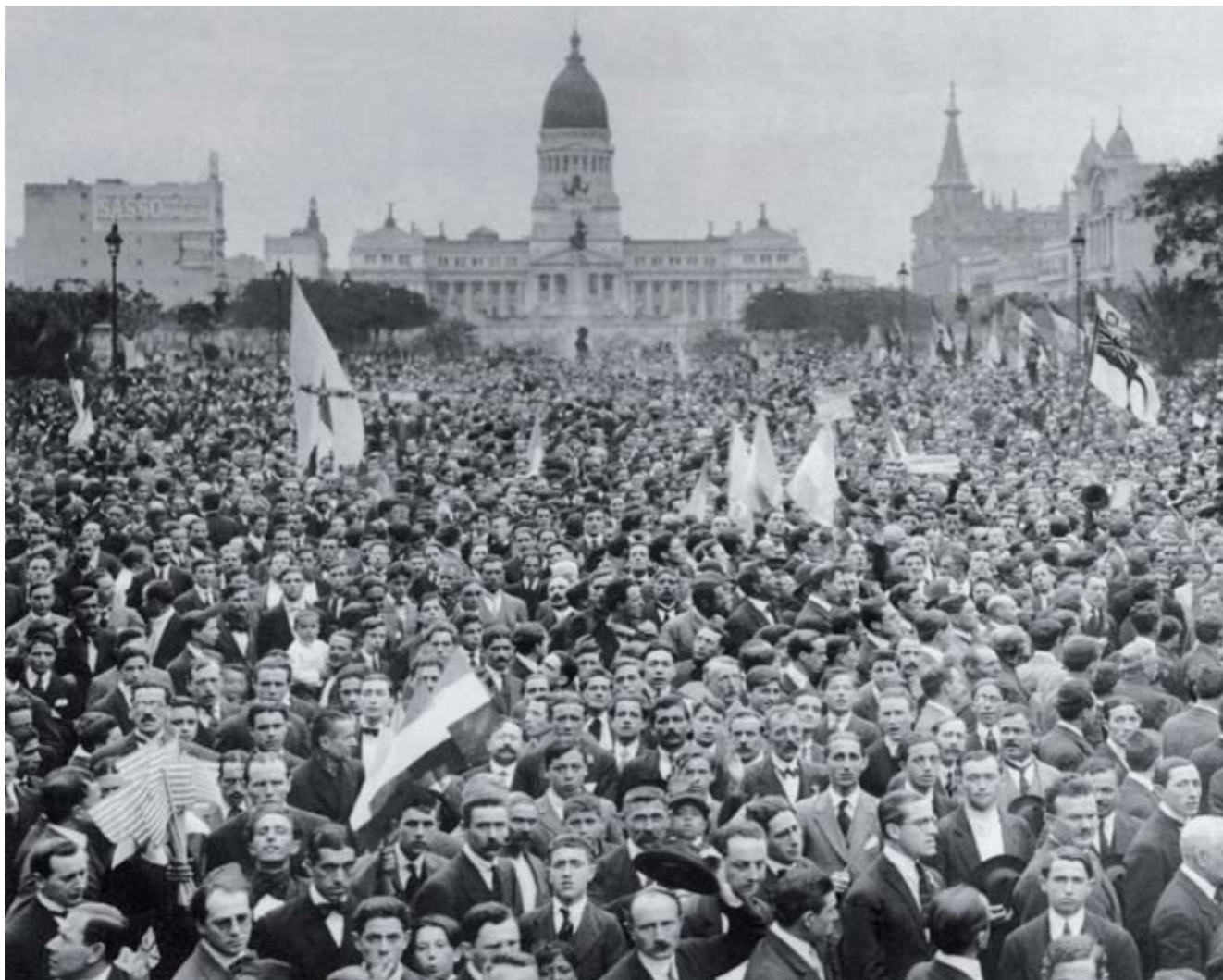
Congregación en plaza Congreso celebratoria del armisticio que puso fin a la guerra el 11 de noviembre de 1918.

cese inmediato de los vínculos diplomáticos con el Imperio. Continuaron defendiendo la causa de los aliados, a la que identificaron con la tradición liberal y democrática de la Argentina.