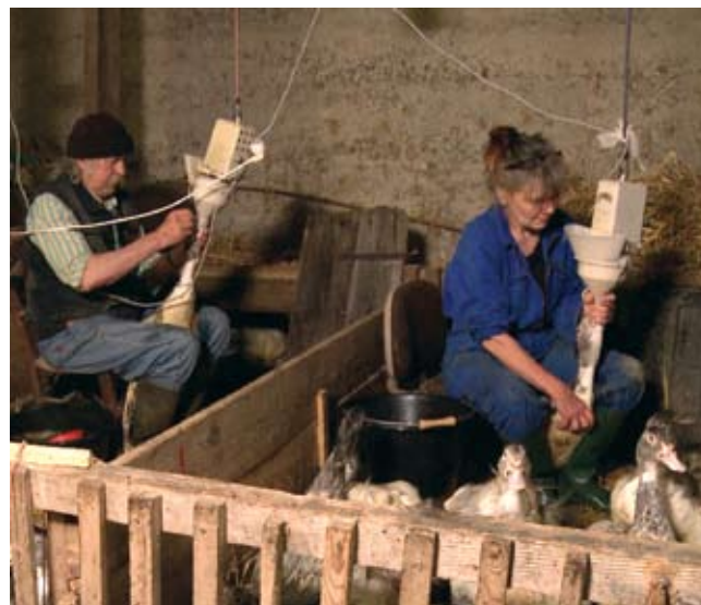
Agricultores franceses de la región francesa de Midi-Pyrénées cebando a los patos.