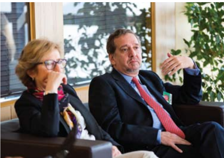
La ministra francesa de la Enseñanza Superior y la Investigación, Geneviève Fioraso, junto con el ministro argentino para la Ciencia, Tecnología e Innovación Productiva, Lino Barañano, durante su visita del Polo Tecnológico MINATEC en Grenoble, Francia, en marzo de 2014.

Programa Bec.Ar: programa lanzado por el gobierno argentino (Jefatura de Gabinete de Ministros), que apoya la realización de estancias cortas (de hasta nueve meses) en instituciones académicas de Francia en el marco de un doctorado iniciado en la Argentina en áreas que sean de desarrollo prioritario para el país.