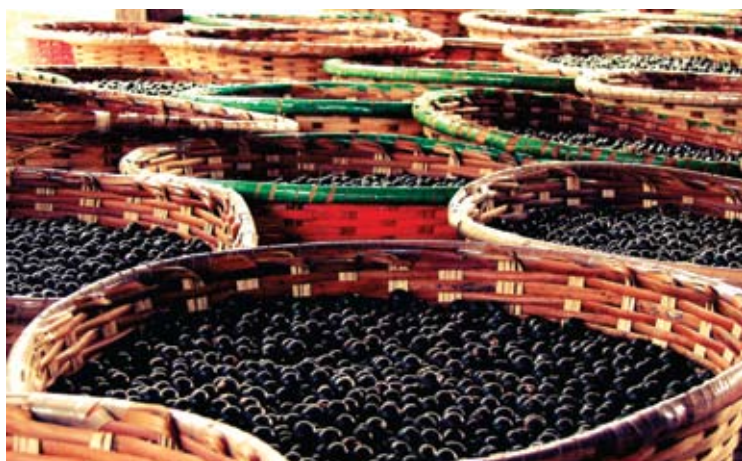
Granos de açai-cameta. Trabajo de campo llevado a cabo en el territorio de la Baja Tocantins, estado de Pará, Brasil. Grupo de Estudios sobre la Diversidad de la Agricultura Familiar (GEDAF), Universidad Federal del Pará.

En el marco del Año de la Agricultura Familiar la revista CIENCIA Hoy lanzó un número especial, en colaboración con el Institut Français d'Argentine. Al mismo tiempo, se presentará en el Museo de Ciencias Naturales "Bernardino Rivadavia" una exposición sobre los roles de la agricultura familiar con relación a la lucha contra la pobreza y el desempleo, la seguridad alimentaria y la preservación del medioambiente producida por el Centro de Cooperación Internacional para la Investigación Agronómica para el Desarrollo (CIRAD). La exposición también circulará por varias