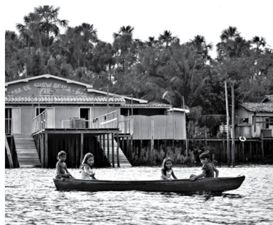
Comunidad que trabaja de la actividad pesquera en el municipio de Cameta. Trabajo de campo llevado a cabo en el territorio de la Baja Tocantins, Estado de Pará, Brasil. Grupo de Estudio sobre la Diversidad de la Agricultura Familiar (GEDAF), Universidad Federal del Pará.

El próximo café sobre agricultura familiar será el 19 de noviembre a las 18.30 en el Polo Científico-Tecnológico, conducido por el profesor Bernard Hubert.