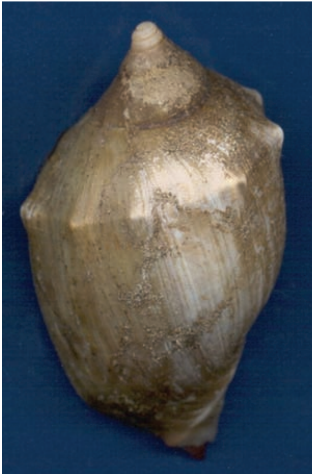
Arriba: oliva globosa ( Olivancillaria deshayesiana ), común en las costas de Mar del Plata.