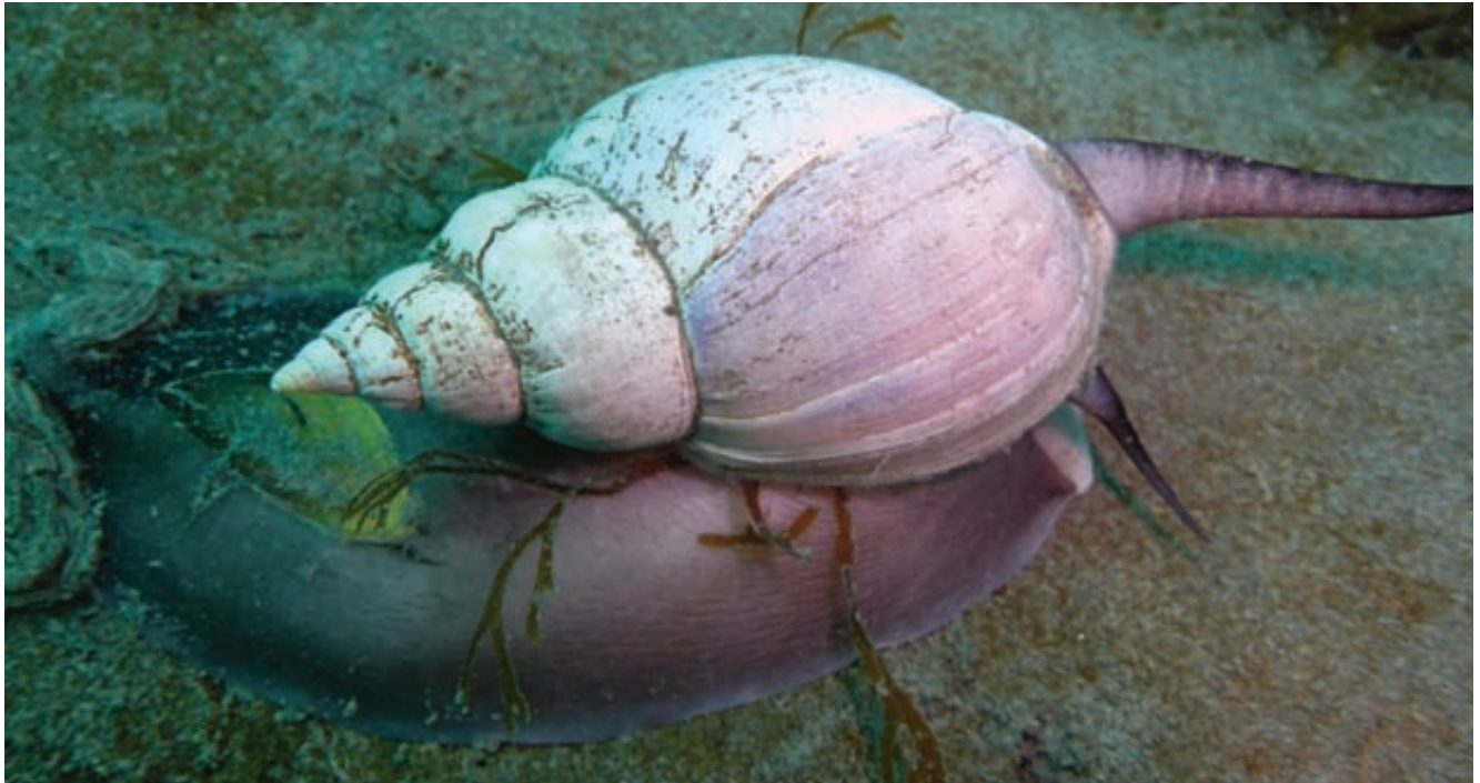
Caracol escalonado ( Buccinanops cochlidium ), que tiene alta fecundidad en la Patagonia, además de gran potencial pesquero.

para los invertebrados marinos. También se explora recurrir a compuestos naturales que evitan las incrustaciones, propios de ciertas algas, esponjas y bacterias.