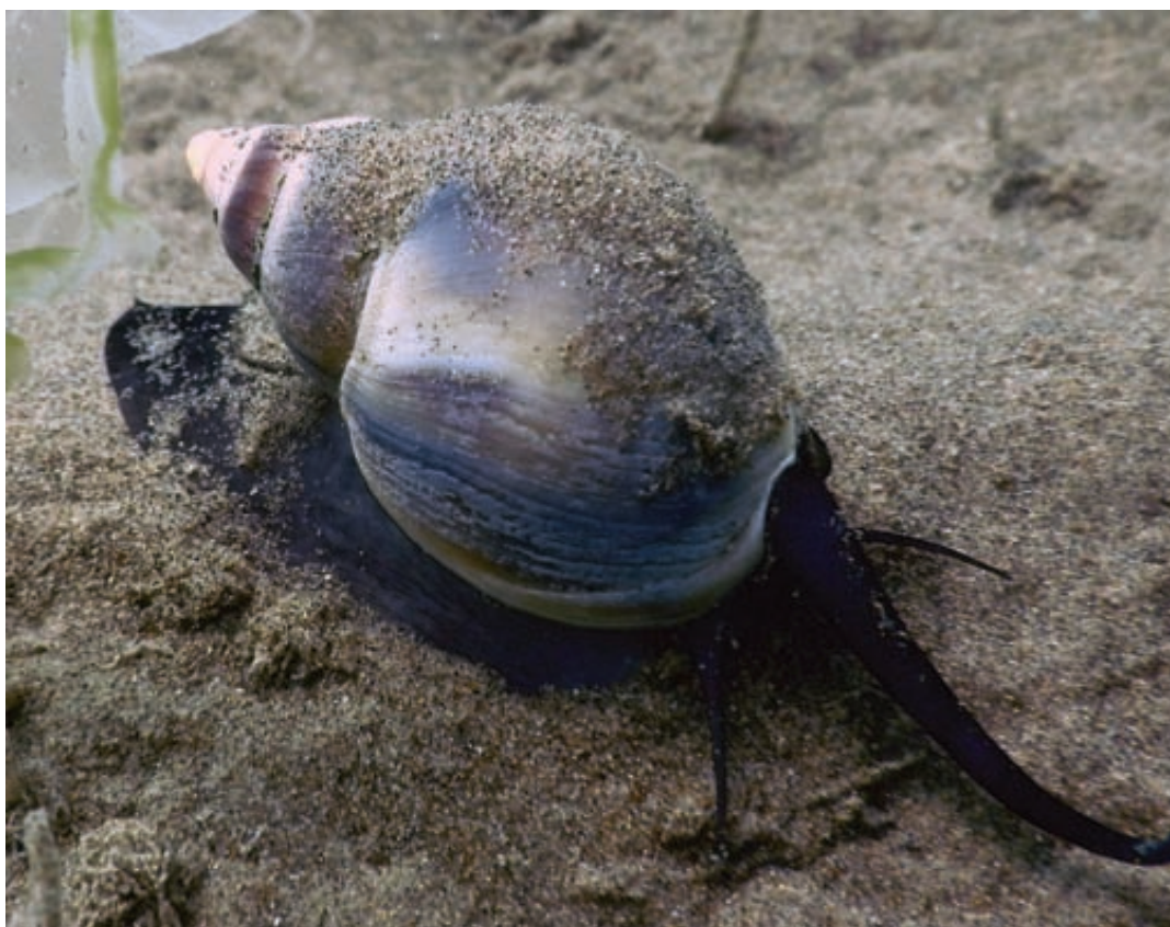
Caracol globoso ( Buccinops globulosus ), especie muy propensa a desarrollar imposex y muy común en la zona intermareal de las costas de la Patagonia, donde es capturado por pescadores artesanales para ser consumido.

acumulando, fenómeno denominado bioacumulación . Por ello, aun en bajas concentraciones en el ambiente, los contaminantes pueden producir efectos adversos para humanos y otros organismos situados el tope de la cadena alimentaria.