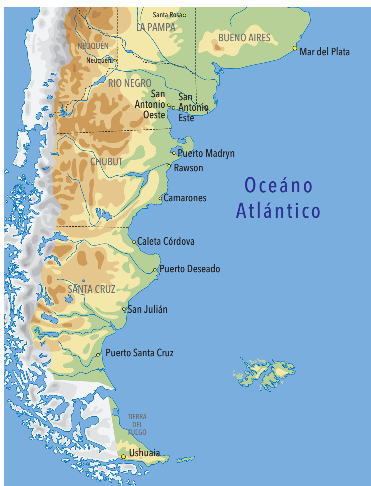
Principales puertos de la costa atlántica argentina donde se han encontrado diversas especies de caracoles con variable intensidad de imposex .