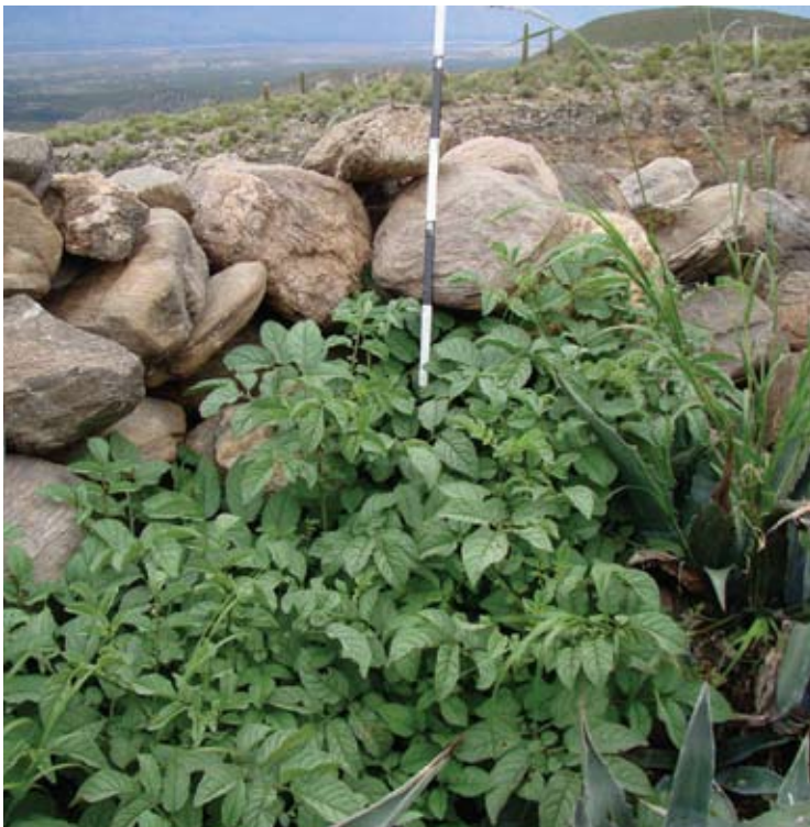
Papas silvestres en Amaicha, provincia de Tucumán. Cada división de la vara que da la escala mide 15cm.

como una zona árida o semiárida, puede haber distintos microambientes: uno húmedo, por acumulación de limo debajo de plantas arbustivas o cactáceas, o en la orilla de cursos de agua o entre los meandros de un río o arroyo, como es muy común en Cuyo y el noroeste argentino; y otro seco, entre rocas o en suelos arenosos.