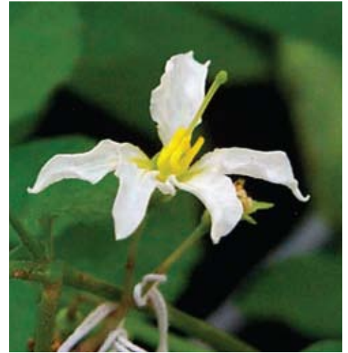
Flores normal (izquierda) y anormal de papa silvestre. La segunda pertenece a una planta estéril en la que operaron las barreras a la autofecundación.