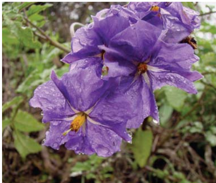
Flores de papa silvestre.

Las papas silvestres pueden reproducirse tanto de manera sexual, por semillas, como vegetativa, por estolones (brotes que se separan de la planta madre) o por tubérculos. La primera permite la formación de nuevas combinaciones de genes y confiere flexibilidad genética a las poblaciones; la segunda origina poblaciones genéticamente homogéneas, compuestas por individuos idénticos o clones. Estos tienen la ventaja de que garantizan la preservación de los genotipos mejor adaptados al ambiente, y la desventaja de que pueden sucumbir ante la propagación epidémica de infecciones, como sucedió en Irlanda en 1845, o ante cambios ambientales drásticos, riesgo