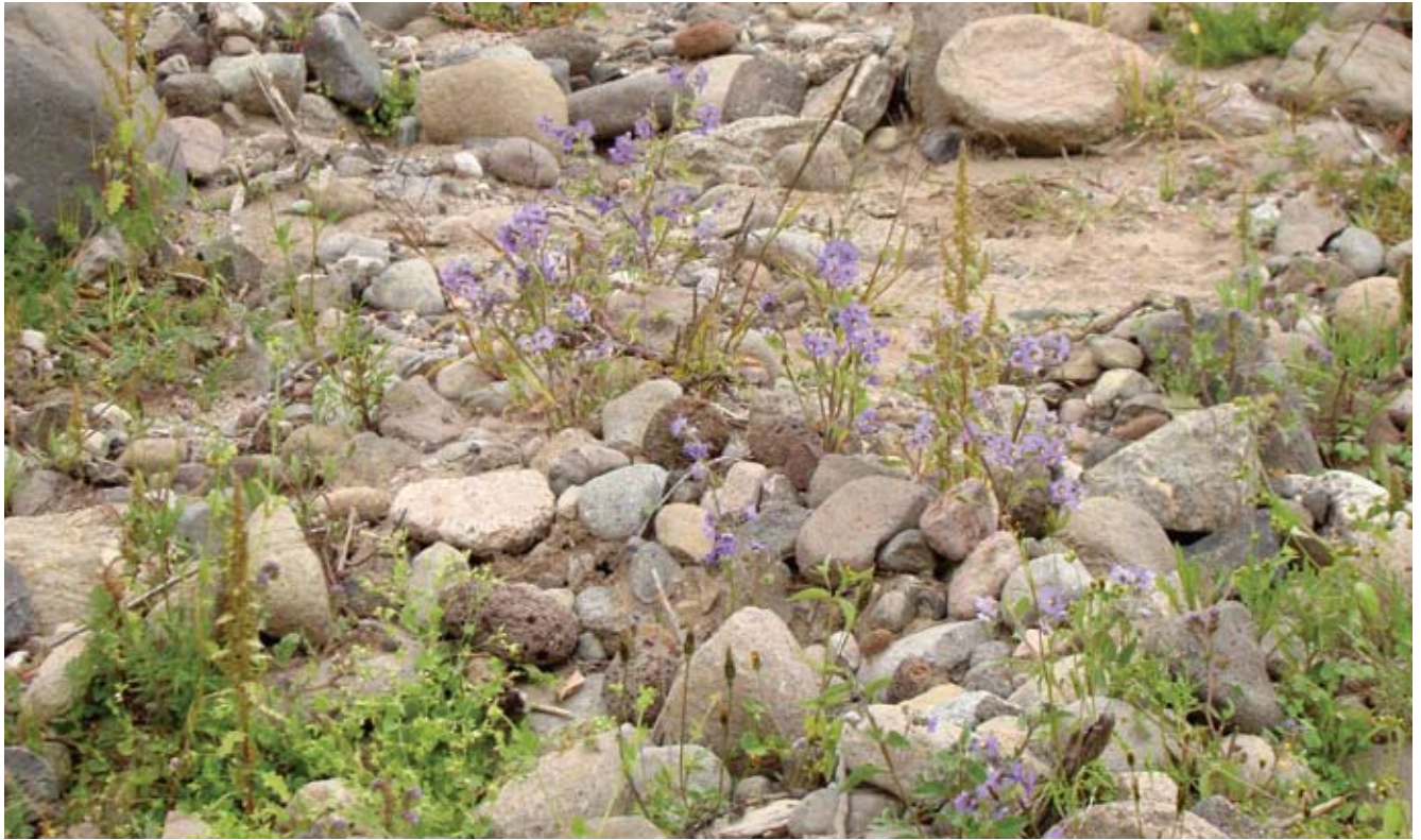
Población natural de papas silvestres en Tafi del Valle, provincia de Tucumán.

poblaciones silvestres de papa se encuentran en diferentes estadios de divergencia evolutiva entre ellas, y no al final de ese proceso, como presupone considerar que cada una es una especie separada. Pero como las papas silvestres se reproducen tanto de manera sexual como asexual, no puede aplicárseles el concepto de especie biológica, que fue concebido para organismos biparentales.