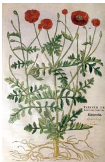
Amapola ( Papaver rhoeas ). Xilografía coloreada a mano de la obra de Leonhart Fuchs Comentarios notables sobre la historia de las plantas , publicada en Basilea en 1574.

También en el siglo XVIII, Erasmus Darwin (1731-1802), abuelo de Charles Darwin, relacionó la variación morfológica de las plantas con su modo de reproducción, que puede ser sexual, por semillas, o asexual, por estructuras vegetativas como tubérculos, gajos, raíces gemíferas u otras. Charles Darwin (1809-1882) retomó las ideas de su abuelo y describió y clasificó gran parte de los grupos entonces conocidos de plantas y animales.