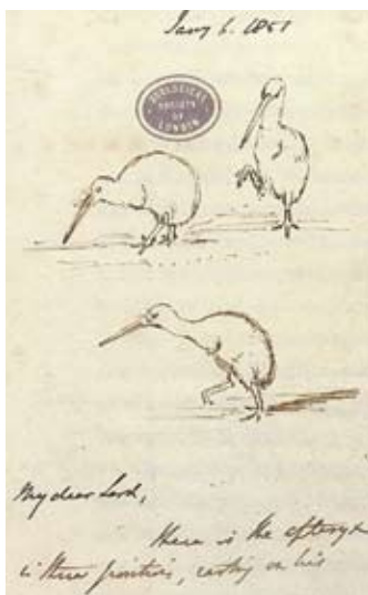
Kiwi ( Apteryx spp.). Croquis de Charles Darwin en una carta que escribió en papel con membrete de la Zoological Society of London, 1851.