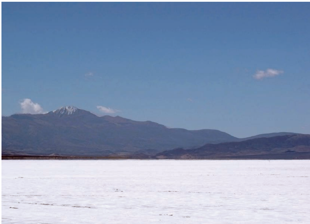
Salinas Grandes, Jujuy. Al fondo se observa el cerro Chañi nevado.

se denominan oligosalinas y las muy saladas, hipersalinas. Los cuerpos de aguas continentales o interiores son el objeto de estudio de una rama de la ecología llamada limnología.