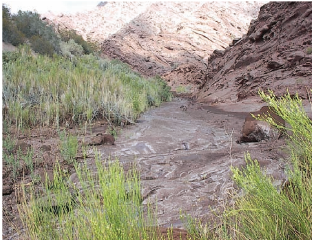
Río arreico ubicado en la localidad de Vinchina, La Rioja. Pueden observarse en la foto las deposiciones de hidrocarburos (manchas oscuras) y sales (manchas blancas).

tes cloacales crudos. Constituye un fenómeno global que está en crecimiento y afecta a ríos, lagos y humedales. Sus consecuencias pueden verse magnificadas como consecuencia del cambio climático y por el incremento de la demanda de agua para consumo humano, en especial en regiones áridas. Según la Organización Mundial de la Salud, en 2008 el 37% de la población mundial sin acceso a agua potable estaba en el África subsahariana.