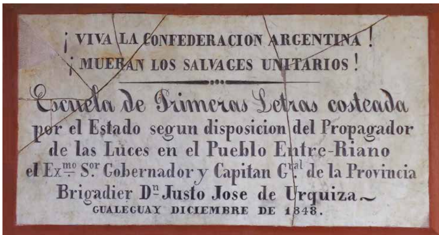
Placa de mármol de la escuela de primeras letras establecida por el gobierno de Entre Ríos en Gualeguay. 60 x 40cm.

meras letras a las que se refiere esta nota, nacidas para sostener las políticas de educación elemental de esos estados. Y aun cuando su número e importancia contrasta con lo que sucedería más tarde, el esfuerzo educativo de los estados de la Confederación no fue insignificante.