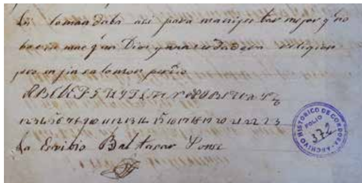
Ejercicios de escritura realizados en 1838 en la escuela de Fraile Muerto. Archivo Histórico de la Provincia de Córdoba, fondo Gobierno, t. 155, letra A, legajo 18.