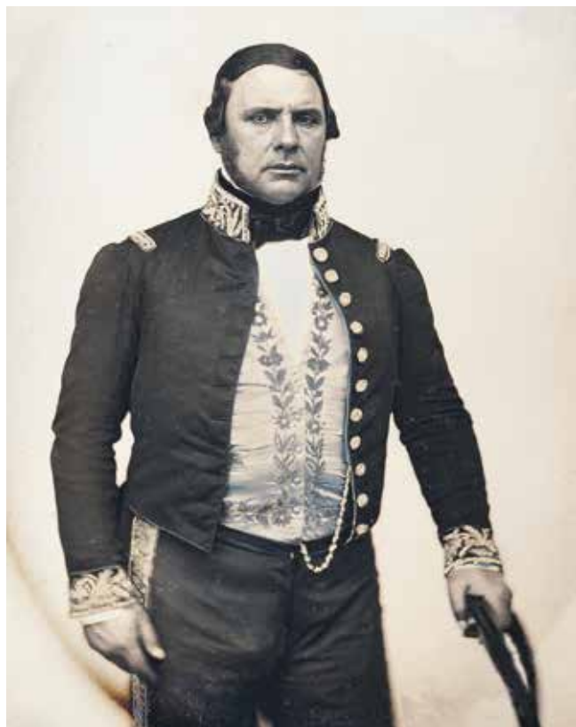
Justo José de Urquiza (1801-1870). Daguerrotipo de fotógrafo no identificado. Primera mitad de la década de 1850. Imagen retocada electrónicamente, Museo Histórico Nacional.

de nuestra religión, es dócil y generalmente sirve bien, mas necesita que lo aviven tocante a la enseñanza de los niños'. Esta sutil afirmación final sugiere algún interés por el desarrollo de capacidades pedagógicas, el cual recién comenzaría a cobrar verdadera relevancia en la segunda mitad del siglo XIX.